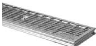
Maskerist 30/10 mm A15 & C250