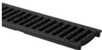
Støbejernsrist C250 & D400 til rende I00V-Line