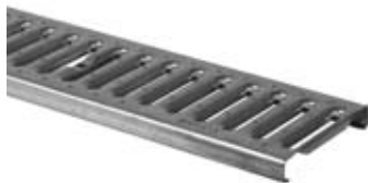
Stigerist A15 galvaniseret