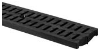
Kunststofrist antracit B125