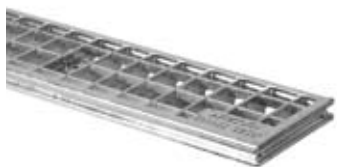
Maskerist 30/30 mm A15 & C250